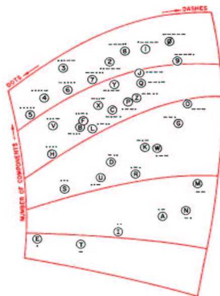
Resultado da experiência com código Morse

Este tipo de análise já foi empregado com sucesso na área de análise de timbres musicais[2]. As pesquisas mostraram que três fatores podem ser es-